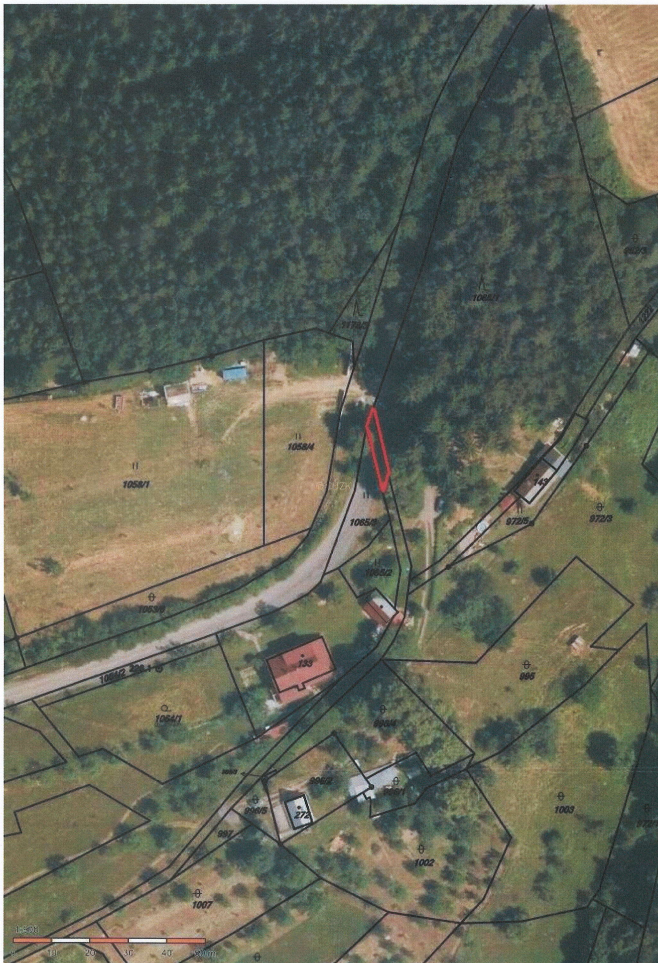
Příloha: Katastrální snímek ortofoto